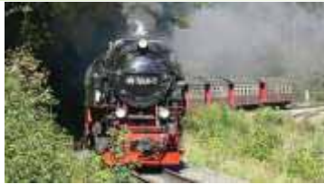
Erich Westendarp / pixelio.de

Wir machen Urlaub in Wernigerode im Harz.